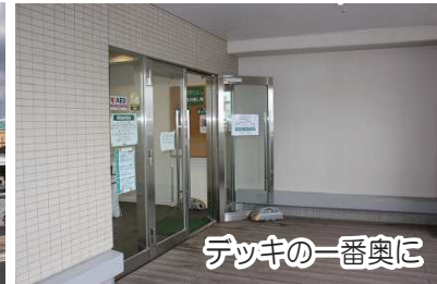
デッキの一番奥に

当館にご来館いただけるようになりました。この機会に2階入り口も開館5分前に開錠することになり、駅からのアクセスがさらに便利になりました。朝8:55～夜22:00までは開錠しておりますのでご利用ください。夏期冷房使用中と風の強い日や豪雨等の場合は扉が閉じていますが、鍵は開いています。駐輪場からも商業施設の駐車場からもご来館が簡単になり「開いて良かった」とはこのことです。古い？これからも皆様のご利用しやすい施設を目指してまいります。さて、次回はどこをご紹介しますでしょうか…？