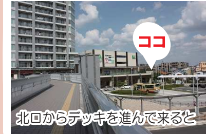
北口からデッキを進んで来ると

皆様こんにちは。ここではみどりアートパークのすべて(一部除く)をご紹介します。さて、第21回は開館当時は開かずの扉とされておりまして2階入り口をご紹介します。なぜ開館当時は使用しなかったのかと言うと、保安上の問題とデッキ利用者が少ないことが理由でした。2014年8月に長津田駅北口から直接